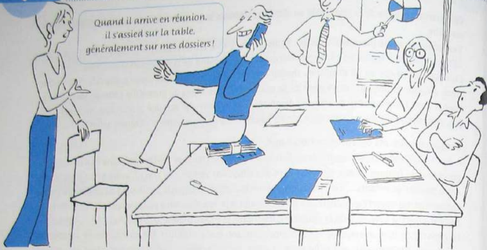
QUEL GOUJAT, CE LÉON !